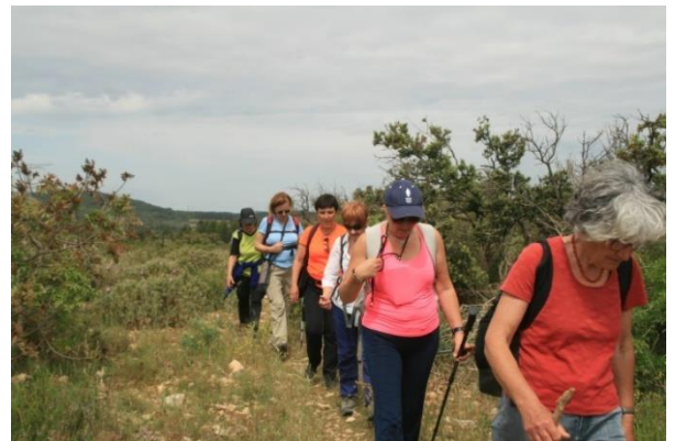
Dimanche nos randonneurs à ARAMON