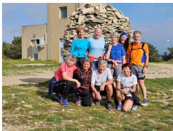
Samedi matin à la tour des pompiers